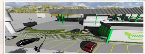
Terreno de 10.000m 2