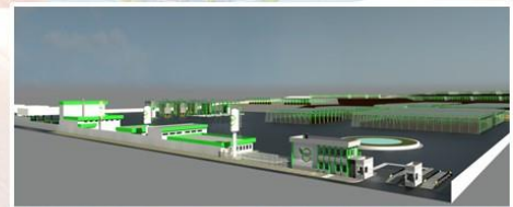
Terreno a partir de 100.000m 2

“Ecologicamente correto, socialmente integrado e economicamente viável”